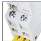
max. poj. zacisków głównych: do 6mm 2