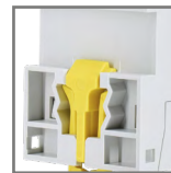
montaż na szynie DIN35