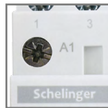
max. poj. zacisków pomocniczych 2.5mm 2